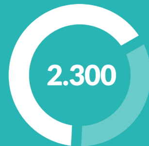
Interventi di Oculistica